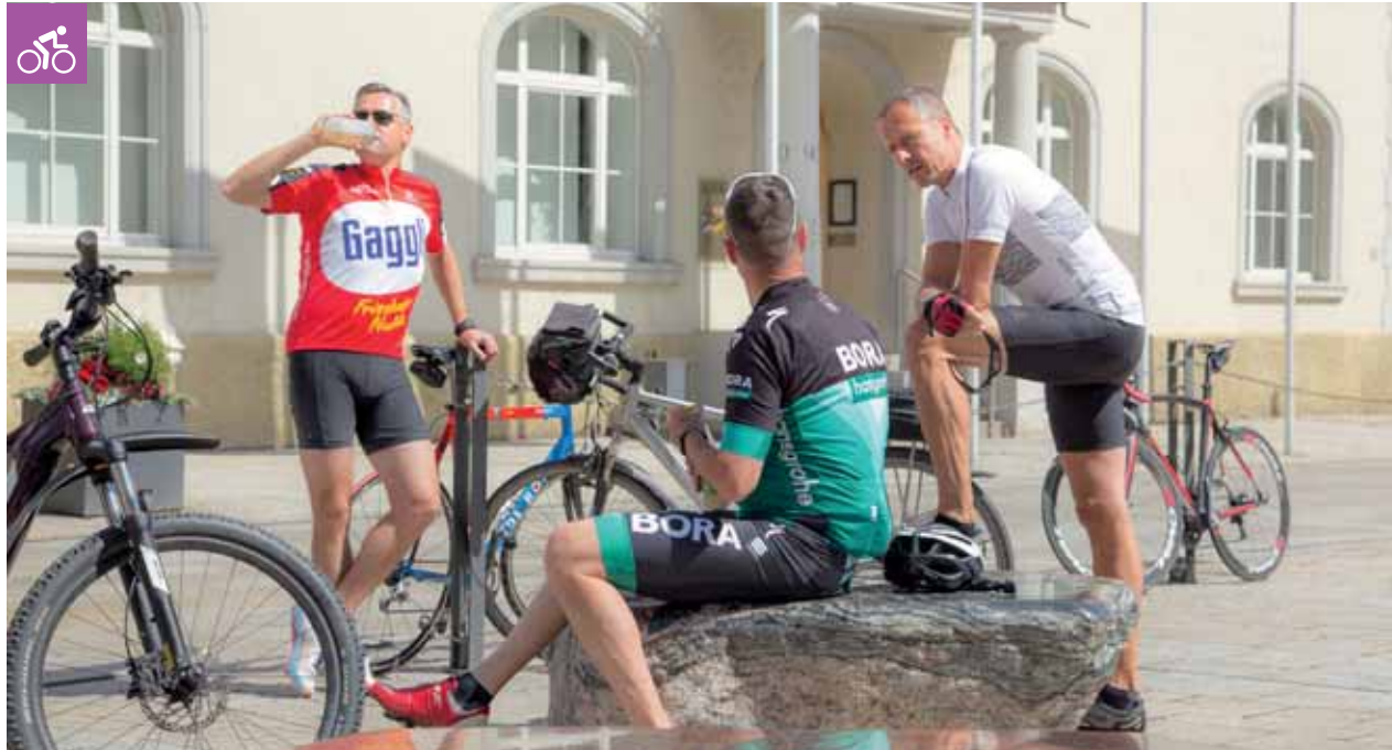
Rast vor dem Mengener Rathaus